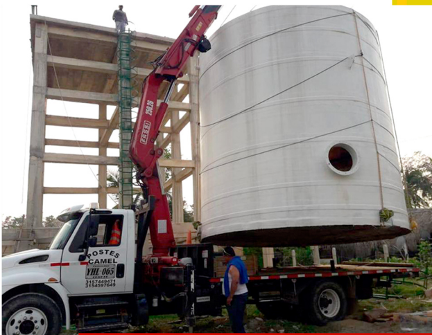
Transporte, manejo e izaje de carga pesada

Vehículos especializados para transportar y manejar postes de concreto, asegurando su entrega segura y eficiente desde la fábrica hasta el sitio de instalación.