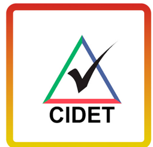
Certificado de conformidad Postes de Concreto